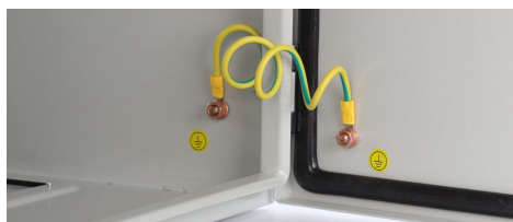
Przewód uziemiający - RAPU-Z