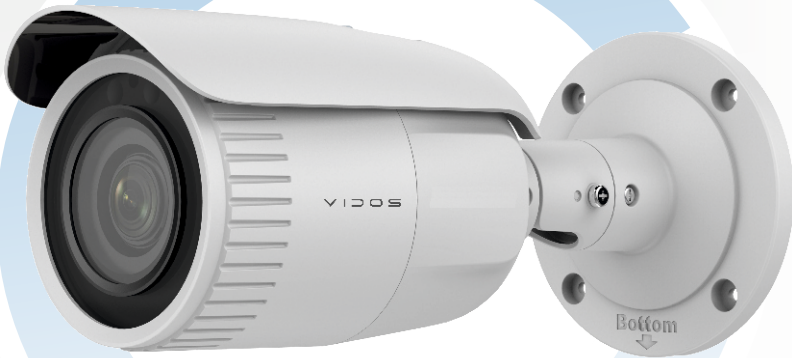
IP-H1640-Z Kamera sieciowa 4MP - tubowa